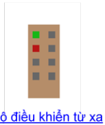
Bộ điều khiển từ xa