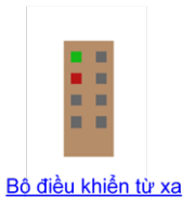
Bộ điều khiển từ xa