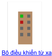
Bộ điều khiển từ xa